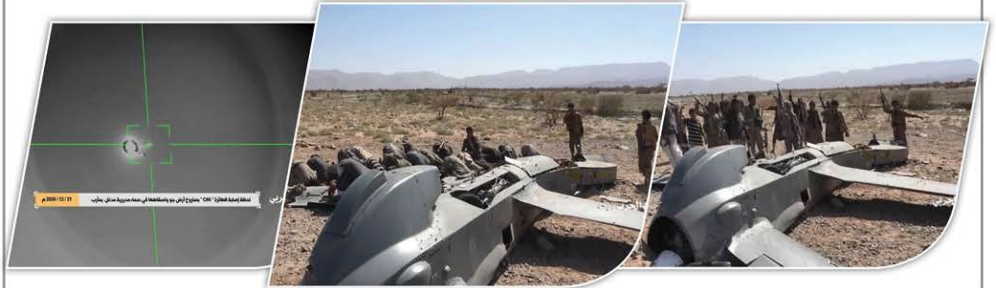
نقطة إسقاط الطائرة "CH4" بصواريخ أرض جو إسقاطها في ساحة معركة مدغل بمأرب | 2020 | 12 | 26

إسقاط الطائرة في منطقة مدغل، التي تمثل حالياً منطقة العمليات الأكثر سخونة، حيث تقع مباشرة على أبواب مأرب الغربية، يفقد العدوان ومرزقته، وبنسبة كبيرة، فرصة المراقبة الفعالة لميدان القتال، وذلك بعد خسارتهم معسكر ماس، الذي طالما شكل نقطة استطلاع ودفاع متقدمة عن مأرب، وبعد استهداف وتدمير غرفة عمليات التحالف في تداوين وإخراجها من الخدمة اليوم، وبعد هذا الإسقاط الناجح للمسيرة المتطورة (CH4) الصينية، الذي يشكل تهديداً جدياً لحركة طائرات