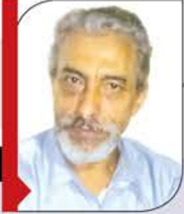
علي نعمان المقطري

تحددت الإمامة في الإمام علي بما احتازه من صفات تقترب من الأنبياء وسماتهم وأخلاقهم وعلومهم وقدراتهم وجهادهم، ولا علاقة لنسبه الشريف بالاختيار الإلهي النبوي بالتكليف، فالتنسب الشريف وحده كان هناك من ينافسه عليه ويفوقه في قرابته للرسول من بني هاشم، والرسول نفسه حدد من يكون آل بيته، فقد أخرج كل من كان غير أهل الكساء الخمسة (علي وابنيه وفاطمة الزهراء)، ولم يفعل ذلك ليجعل منهم طبقة فوق الناس انطلاقاً من العرقية والدم والنسل والسلالة تتحكم برقاب العباد وتتملكهم بقوة السيف والمال والترغيب والترهيب.