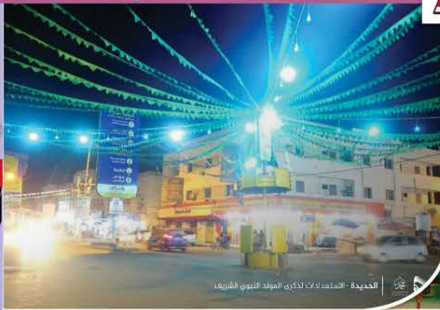
الحديدة - الاستعدادات لذكرى المولد النبوي الشريف