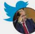
يحيى أبو زكريا

إن ما يحدث الآن من حشد ديني إسلامي مسيحي أو إسلامي علماني هو معركة سياسية خاصة بين تركيا وفرنسا أو بين تركيا وأوروبا. عندما بدأ العثمانيون في السطو على الكنائس ثم دعموا القاتلين والذباحين بدعوى الرسول، لا تنتظر من الأوروبي احترام دينك أو الاقتناع بنزاهته!!