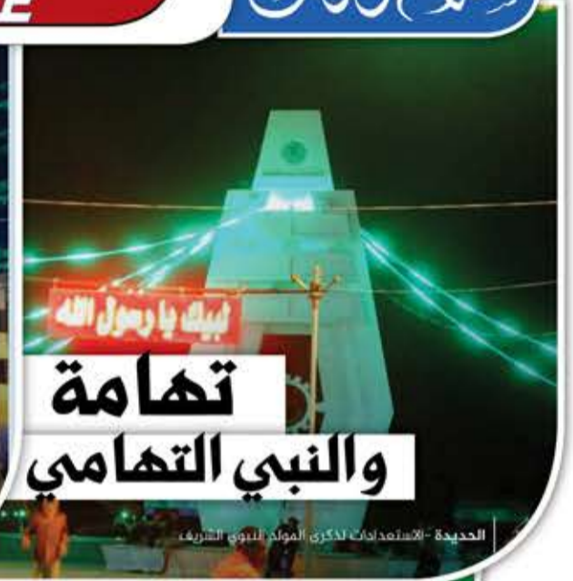
الحديدة - الاستعدادات لذكرى المولد النبوي الشريف