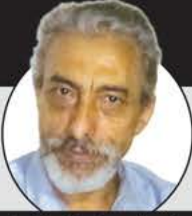
علي نعمان المقطري

خلال سنوات خمس عصيبة لكنها واعدة، خاض شعبنا وجيشنا الثوري الشعبي الوطني معارك كثيرة لا تحصى ولا تعد، تجاوزت العشرة آلاف معركة ميدانية ودفاعية وهجومية، حسب إحصائيات رسمية للناطق باسم القوات المسلحة اليمنية، وفي أكثر من خمسين جبهة حربية في ميادين واسعة تشمل الجغرافيا اليمنية في كل الاتجاهات، في ظل حصار خانق يشهد كل يوم ويزيد من معاناته ومصاعبه وآلامه وضحاياه، والشعب وقواته صابرون وصامدون يسيرون للأمام على جبال من المعاناة، لم يفقدوا أبداً إيمانهم بالنصر وبدعم الخالق للمستضعفين وهو خالقهم وراعيهم وحارسهم.