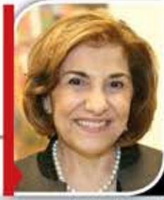
د. بثينة شعبان

المستشارة السياسية والإعلامية للرئاسة السورية