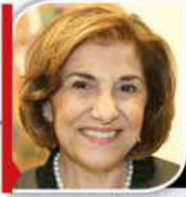
د. بشيرة شعبان

المستشارة السياسية والإعلامية للرئاسة السورية