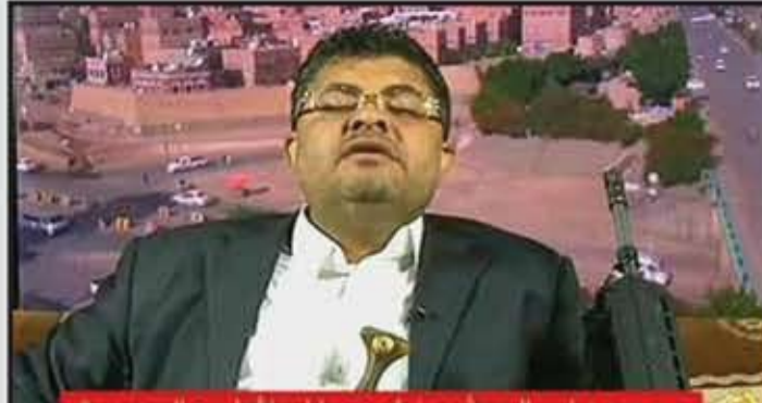
محمد علي الحوثي: تؤيد حواراً مباشراً مع السعودية وما جرى بيننا من اتصالات يرضى إلى مستوى التفاوض

مستشار الأمن القومي الأمريكي: أمل أن يرى الملك سلمان وولي عهده هذا