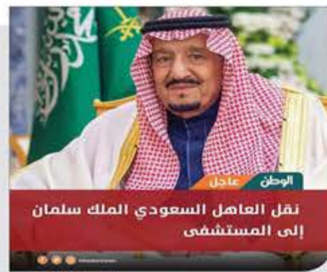
الوطن عاجل نقل العاهل السعودي الملك سلمان إلى المستشفى

بتوجيهاته توقف الحج، وقتل الشعب اليمني، وتفرقت الأمة الإسلامية... وجاءت التوجيهات الإلهية بتوقيف حياته باذن الله. العاهل السعودي يدخل المستشفى، وبعقل دخله الثلجة!