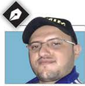
عبد الملك سام

بالله وبمجاهديننا البواسل، وكان يمكن أن نوعي شعبنا بخطر ما يعرضه هذا المبعوث منذ البداية، خاصة وعرضه لا تقل سخفا عما كان يقوله في جلسات مجلس الأمن الدولي، وقد رأينا كيف انزعج الناس من طلبه لحكومتنا عدم صرف نصف المرتب لموظفي الدولة.