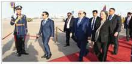
السبت 23 فبراير 2019 الساعة 17:44 بين سكاكي - منطقة خالصة

وصل الرئيس اليمني عبدربه منصور هادي الى مدينة شرم الشيخ المصرية مساء اليوم السبت.