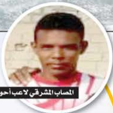
المصاب المشرقي لاصب أحور