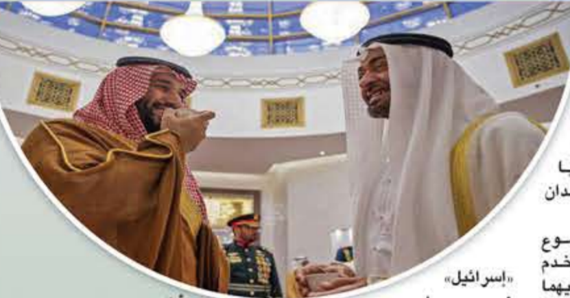
«إسرائيل» هي من يقوم بالأمور الحركية، ويعتقد بأن «إسرائيل» هي التي تقف وراء تفجير ضخم وقع في «نطنز» داخل مختبرات تجميع أجهزة الطرد المركزي لتخصيب اليورانيوم، وربما تقف أيضاً خلف ما يقرب من 6 انفجارات غامضة أخرى وقعت في إيران وإقليمها. تعمل الإمارات و«إسرائيل» بالترادف، وتحتمي كل منهما ظهر الأخرى. ولكن ذلك لا يعني أن المشروع مستقر أو أنه مؤهل للبقاء على المدى البعيد. وربما وجدت «إسرائيل» بالفعل أن من المفيد أن تجاري محمد بن سلمان وتطلعته الشخصية خدمة لمصالحها هي، والمتمثلة في إبقاء الفلسطينيين رهن الاحتلال الدائم. ولكن مصالحتها القومية تأتي في المقام الأول.

وهذا هو الأردن الذي عمل عن قرب مع «الإسرائيليين» أكثر من أي بلد عربي آخر. يقف على حافة الإفلاس، ويعاني من بطالة شديدة وتفسخ اجتماعي، ومع هيمنة اليمين الاستيطاني في «إسرائيل» لم يعد لمصالح الأردن الاستراتيجية في الضفة الغربية والقدس من شأن. وفتح التي اعترفت به «إسرائيل» تسأل نفسها السؤال نفسه: لماذا قمنا بذلك في أواسط؟ ماذا حققنا من ذلك؟ ولعل هذا الحوار يقربهم أكثر فأكثر من منافسيهم في حركة حماس.