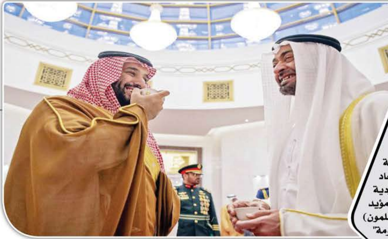
أدين محمد صديفة "ميدل إيست آي" البريطانية

أدى الربيع العربي خلال الفترة (2010 - 2011) إلى شروخ سياسية وجيوسياسية. وتعلق الانقسامات السياسية بالتطورات التي لحقت بالأنظمة التي اندلعت الثورات ضدها، بينما تتعلق الانقسامات الجيوسياسية بتوازن القوى في جميع أنحاء العالم العربي. في وقت مبكر من الانتفاضتين التونسية والمصرية، اتضحت 3 محاور جيوسياسية متميزة في الشرق الأوسط: محور معاد للثورة بشكل علني بقيادة السعودية والإمارات، ومحور إصلاح إسلامي (مؤيد للجهات الثورية بما في ذلك الإخوان المسلمون) بقيادة تركيا وقطر، و"محور المقاومة" (مقاومة الولايات المتحدة وإسرائيل)، وتجسده إيران وسوريا و"حزب الله".