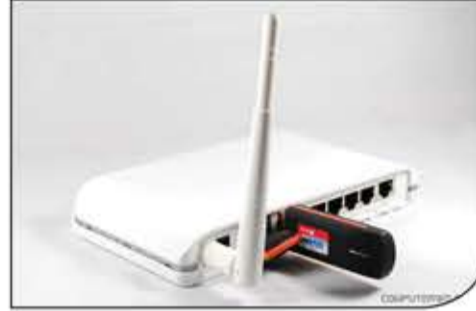
المستخدمين المتصلين بالمودم.

يمكنك من خلال مدخل USB الموجود في المودم استضافة مودم USB (فلاشة نت) وتوزيع شبكة Wi-Fi باستخدام اتصال G4. تعتبر هذه الميزة رائعة للحصول على إنترنت احتياطي عندما تكون خدمة النطاق الأساسية الخاصة بك مثل DSL أو الكابل غير متوفرة؛ ويحبذ أيضاً أن تكون فلاشة الإنترنت المستخدمة تابعة لشركة المودم نفسها لكي تتجنب حدوث أي مشاكل.