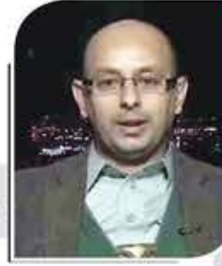
السفير محمد محمد السادة*

بعد نصف عقد من عدوان التحالف السعودي على اليمن أضحت صنعاء أكثر بعداً عن النيل منها عسكرياً، فيما أضحت المدن السعودية والإماراتية بما فيها من بنك أهداف عسكرية وحيوية في مرمى قوات الجيش واللجان الشعبية. أما سياسياً فقد أبدى المجلس السياسي الأعلى وحكومة الإنقاذ في صنعاء قدراً عالياً من المرونة والاستعداد للتقارب مع كل الأطراف، وفي مقدمتها النظام السعودي، لوقف العدوان وإحلال السلام العادل والمشرف للجميع. وفي إطار ذلك قدم "السياسي الأعلى" مبادرة شاملة للحل من خلال تقديمه رؤية وطنية لايقف العدوان، وهو الأمر الذي افتقدته بقية الأطراف، لاسيما النظام السعودي الذي يكتفي بإجراء اتصالات سرية مع "القوى الوطنية في صنعاء".