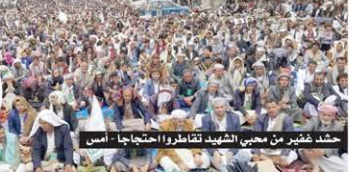
حشد ضخم من محبي الشهيد تقاطروا احتجاجاً - أمس