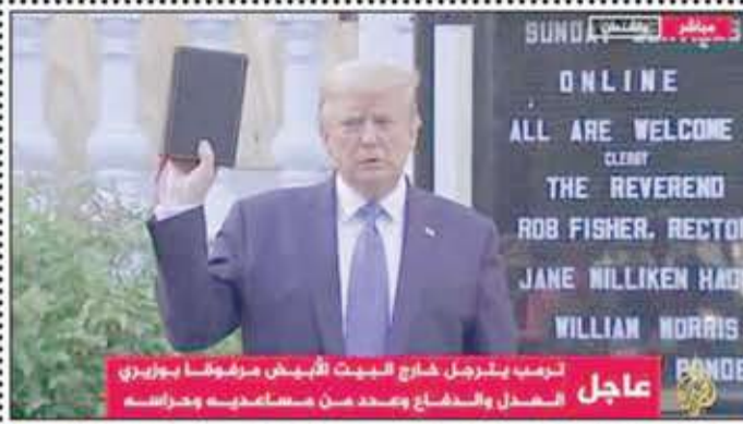
عاجل ترامب يتبرجل خارج البيت الأبيض مرفوعاً بوزري الهدل والندفاع ويصد من معاصديه وحراسه