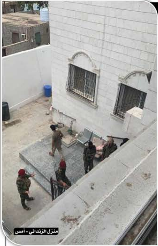
منزل الزنداني - أمس