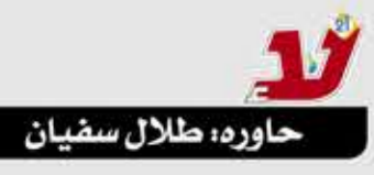
حاوره: طلال سفيان

سنوات من المتعة والابداع والنجومية... سنوات استمتعت فيها الجماهير الرياضية بأرقى الابداع الكروي... الهداف الماكرو... مرحلة ذهبية لن تمحى من تاريخ كرة القدم اليمنية! "الثعلب" لقبه الذي ظل معه حتى اليوم دون أن ينتزعه منه أحد. عزيز الكميم هو تجسيد لقانون أن كل إبداع يعشق، وأن كرة القدم، قطعة الجلد المتفوخة، قادرة على أسر الألباب، يمن يدايعها بطن. لم يغيره مرور الزمن وتغير الأحوال. هو ذلك في السبعينيات أو في الوقت الحاضر، يعشق الشغف. في عمر الـ64 يسير متبخترًا مزهواً بماضيه الناصع الذهبي. عبقرية المهارات، وعبقرية الابتسام، عبقرية الأهداف الخالدة، والتساؤلات التي لا تعقبها إجابات، لأن عزيز الثعلب هو الإجابة العبقرية.