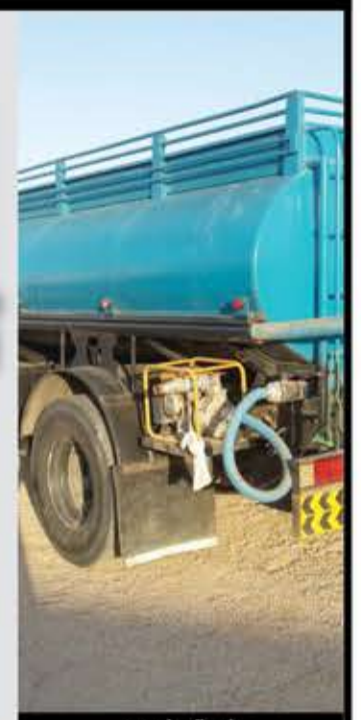
استطلاع: مالك الشعراي/لا

صحيضة «لا»، سلطت الضوء على هذه المشكلة، واستطلعت آراء المواطنين ونقلت معاناتهم، وخرجت بالحصيلة التالية.