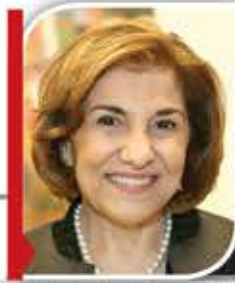
د. بثينة شعبان

المستشارة السياسية والإعلامية للرئاسة السورية