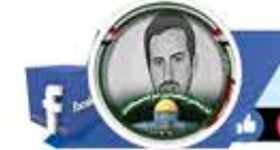
جهفي يحيى جهفي الجهفي

ضروري يعملوا جدول لاستهداف «تل أبيب» ويسموه جدول الضرب!