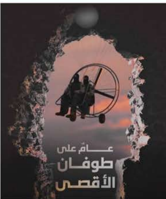
عام طوفان الأقصى

صنعاء حاضرة الأمة. لم يبق في الميدان الفسيح موطئ قدم.