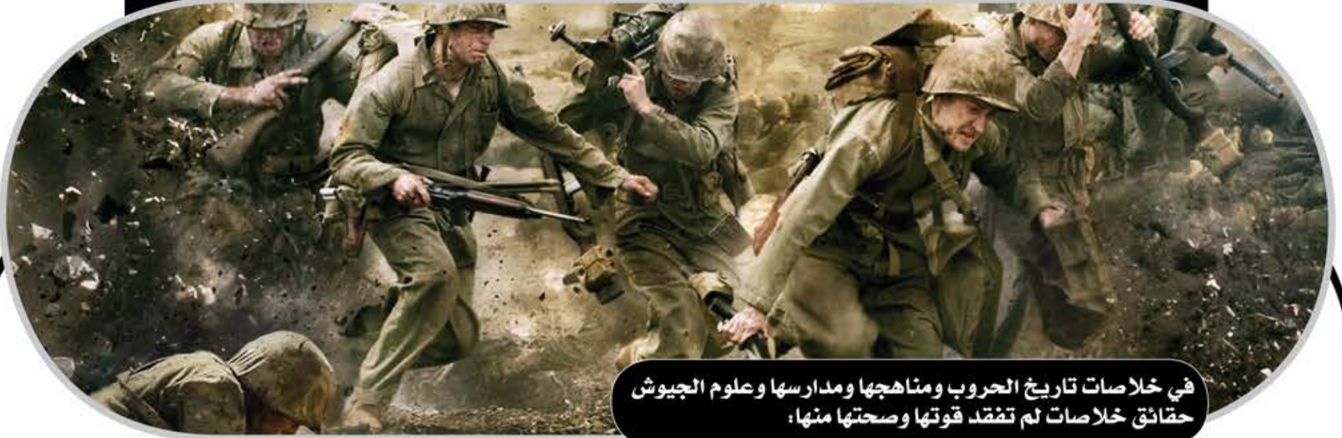
في خلاصات تاريخ الحروب ومناهجها ومدارسها وعلوم الجيوش حقائق خلاصات لم تَمُتد قوتها وصحتها منها؛

أمم وشعوب على ضفتيها وتحاول دول وأمم أن تستثمر فيها وانتظار نتائجها لتقرير دورها ومكانتها بهدف أن تحصد النتائج بلا أكلاف. فهكذا صعدت أمريكا وحكمت العالم وقاعدة تأسيسها ومن الآباء المؤسسين القرصان مورغان الذي تخصص بالكمائن على الشاطئ للقرصنة عندما يعودون بالكنوز مرهقين ببطش بهم وينزعها منهم.