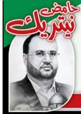
الرئيس الشهيد صالح الصماد

يكفيكم فخراً وشرهاً يا أبناء اليمن أنكم السباقون لإحياء ذكرى مولد الرسول الأكرم بعد تغييبها لعقود من الزمن، وأنتم السباقون لإعادة الأمة إلى النهج المحمدي القرآني، وسترون كيف ستنتشع الظلمة ويضهم الآخرون ويحيون هذه الذكرى.