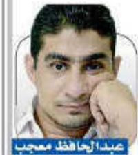
عبد الجافتد معجبا