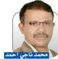
محمد ناجي أحمد

وتلك التي سيرها كغزوة مؤتة... الخ. تميز النبي محمد بقدراته الحربية والذهنية، ورافق ذلك تعاضد البعد الإيماني للبعد الحربي، في تماسك المسلمين، وصدأ للهزيمة من أن تتغلغل في النفوس. فقد صلى الرسول أثناء هزيمة أحد قاعدا وصلّى خلفه أصحابه قعوداً، وجراح النبي وأصحابه حية تسيل بالحزن والكربة ووقع الهزيمة بقية ص 13