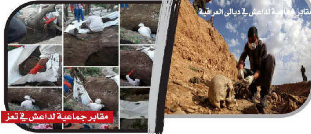
مقابر جماعية لداعش في ديالى العراقية