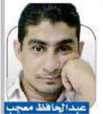
بقية ص 12

المؤسف أن الجثث تم اعدام وتصفية الذين كانتهم بطرق وحشية، فبعضها مفصول الرأس والبعض الآخر رميا بالرصاص، فيما تحللت جثث أخرى، ومن المرجح أن الجثث تعود لمقاتلين