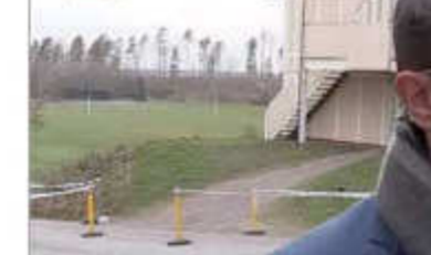
وفد صنعاء أكد استعدادهم لتوفير كل الإمكانيات لتسهيل على التوصل إلى حل سياسي شامل