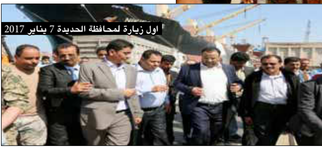
أول زيارة لمحافظة الحديدة 7 يناير 2017