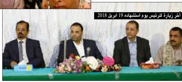
آخر زيارة للرئيس يوم استشهادته 19 أبريل 2018