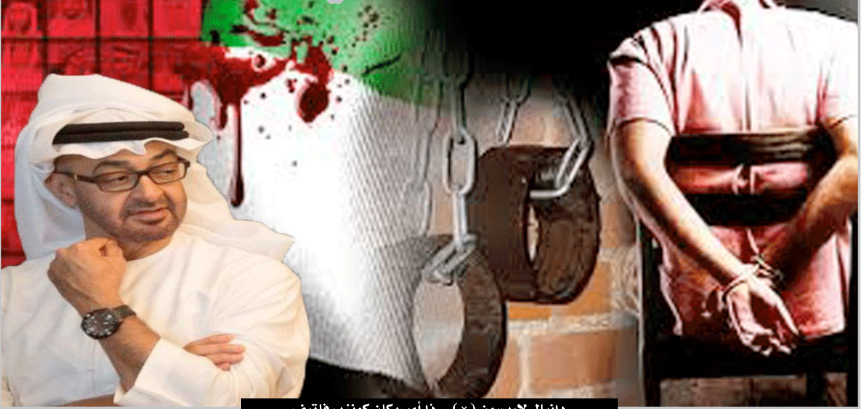
دانيال لاريسون (×) - ذا أميركان كوتزيرفاتيف

الرياض: إنهم يرتكبون في السجون أبشع الجرائم. وأصبح الانضمام إلى داعش والقاعدة طريقة للانتقام من جميع الانتهاكات الجنسية واللواط. ومن هنا، من هذه السجون، يتم إنتاج داعش).