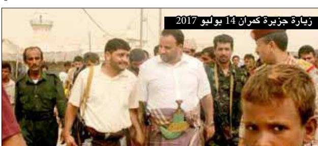
زيارة جزيرة كمران 14 يوليو 2017

ومشائخها ووجهائها. وهذا اللقاء كان الأخير للرئيس قبل استشهادته، وفيه تحدث لأبناء الحديدة رداً على ما قاله السفير