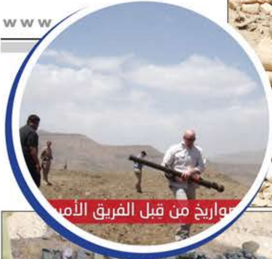
صواريخ من قبل الفريق الأمني