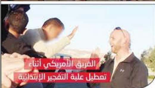
الفريق الأمريكي أثناء تعطيل علبة التفجير الإبتدائية

المنصرم مشاهد لتدمير صواريخ الدفاع الجوي وقبضات إطلاقها وبطارياتها بين عامي 2005 و2009، بإشراف من العدو الأمريكي، وتوافق من نظام الوصاية الذي تزعمه الصريع عفاش عبر نجل شقيقه الخائن عمار عفاش، وكيل جهاز الأمن القومي حينها، حيث جرى تفجيرها على دفعتين بلغ عدد ما دمر فيها 1263 صاروخاً من نوع "سام 7 ستريلا" و"سام 14" و"سام 16"، بالإضافة إلى تدمير 53 قبضة إطلاق و103 بطاريات صواريخ.