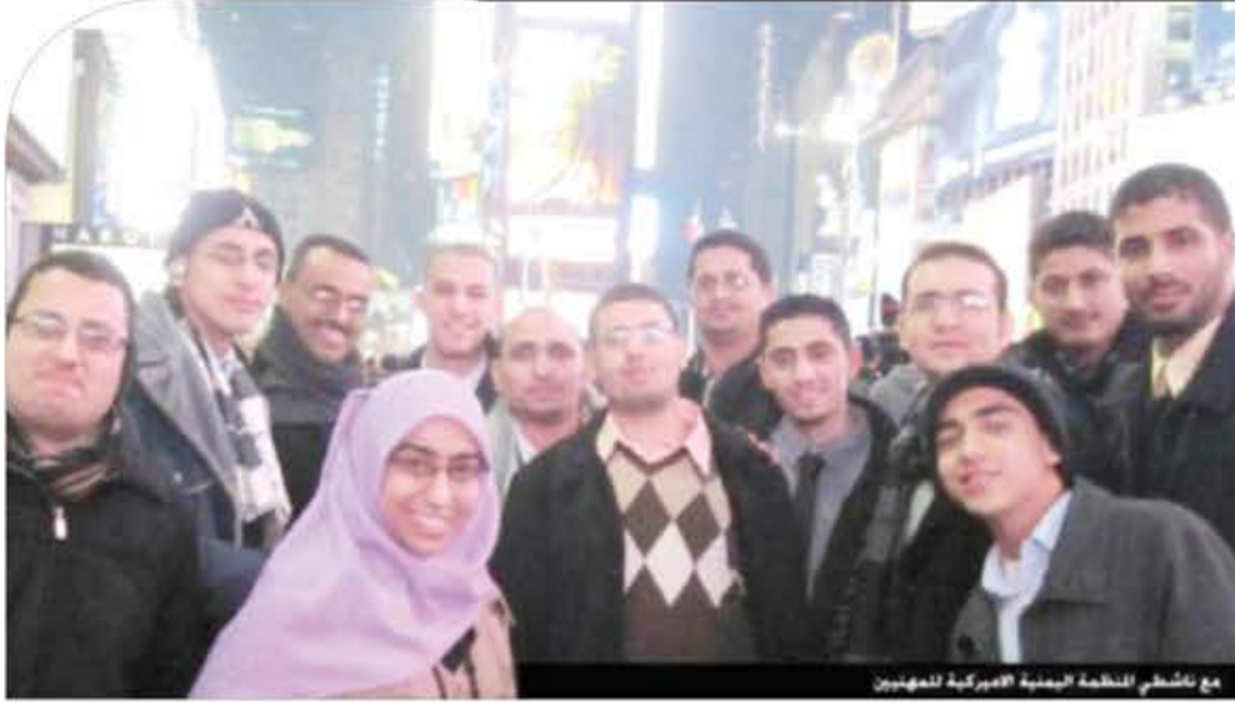
مع ناشطي المنظمة اليمنية الأمريكية للمهنيين

بدأت الثورة الصناعية الثانية في العالم بالتوسع في صناعات الصلب بدلاً من التركيز على الحديد فقط، فمن خلال ضخ الهواء النقي في الأفران يتحول الحديد مهما كانت نوعيته إلى صلب (فولاذ). ثم جاء بعد ذلك مباشرة اختراع الدينامو، الذي فضله استطاع العلماء تحويل الطاقة الميكانيكية إلى طاقة كهربائية. ولاحقاً تم اختراع أول محرك (موتور) في عام 1876 يعمل على أساس الاحتراق الداخلي، وهو ما فتح المجال أمام صناعة السيارات. كل ذلك كان من أهم منجزات الثورة الصناعية الثانية، وهذا أمر يكاد يعلمه الجميع، لكن ما لا يعرفه الكثيرون أن اليمنيين كان لهم إسهامات وبصمات في هذه الثورة الصناعية، وهو ما سنوضحه طي هذا التقرير.