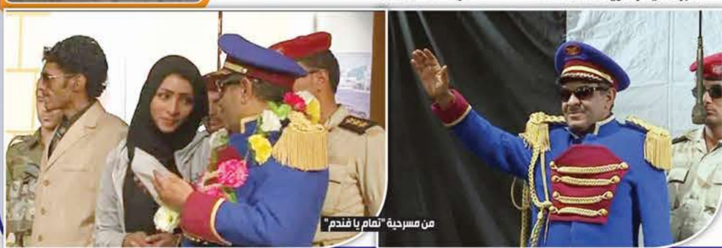
من مسرحية "تمام يافندم"

الحب حياة، والحب بمعناه الواسع حبك لوطنك، حبك لله.