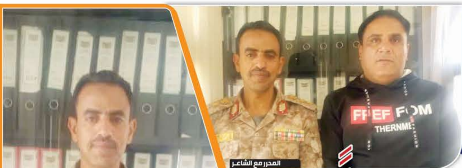
المحرر مع الشاعر