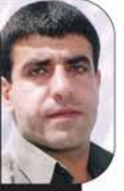
مدني المقتل الأسير السوري

من جانبي شكرت روسيا على هذا الجهد وكذلك الرئيس بوتين، ووجهت لهم التحية