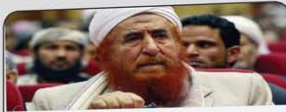
(البروفسور الأردني) مشعل مواقع التواصل الاجتماعي

بروفسور، بلعناها! بمشاركة أردوغان، بلعناها! لكن الطب الحلال، يعني أيش؟! طيب لما مرضت يا بروفسور بـ"البروستاتا"، دخلت واتعالجت بالطب الحرام!؟