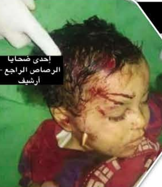
إحدى ضحايا الرصاص الراجع

توفيت أمس طفلة في محافظة تعز نتيجة إصابتها برصاصة طائشة في الرأس. وقالت مصادر محلية لصحيفة «لا» إن طفلة في منطقة الحوبان بتعز توفيت بعد إصابتها في رأسها بعبارة ناري راجع. وكانت طفلة لقيت مصرعها بعد بعبارة