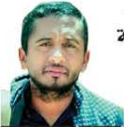
شاعر الأحرار أبو العباس

لا تواعدنا على المحتل فرفر واندحر يا حي شوف الموت حية وامتقع لونه من الفاجع وصفر شاف شجعان اليمن ما هم شوية كم منافق سامته في كل محور واسقته من حوضها كاس المنية