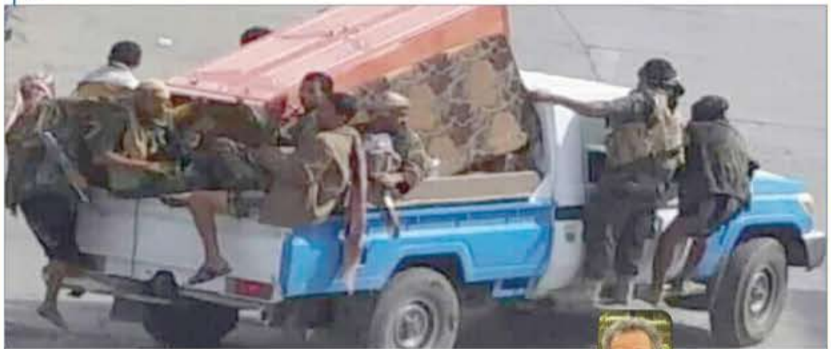
الشرطة في تعز في خدمة العصابات وتوصيل للمنازل!