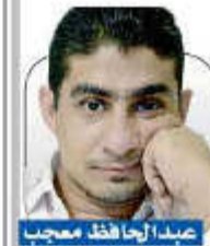
عبد الجافد معجبا

الجنرال باتريك الذي عمل لسنوات طويلة في القوات البحرية الملكية الهولندية ضمن عمليات لحفظ السلام . ومستشاراً عسكرياً في قسم حفظ السلام في الأمم المتحدة . ومسؤولاً عن تطبيق توصيات تقرير الأخضر الإبراهيمي لحماية منشآت وعاملي الأمم المتحدة في جميع أنحاء العالم . ورئيساً للتحقيقات في أحداث جوبا وأداء قوات حفظ السلام في جنوب السودان