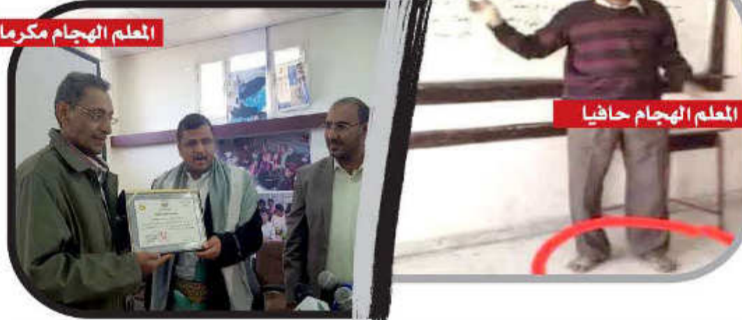
المعلم الهجام حافيا