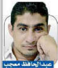
بقية ص 12